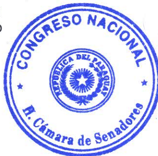
Fernando Lugo Méndez Presidente H. Cámara de Senadores